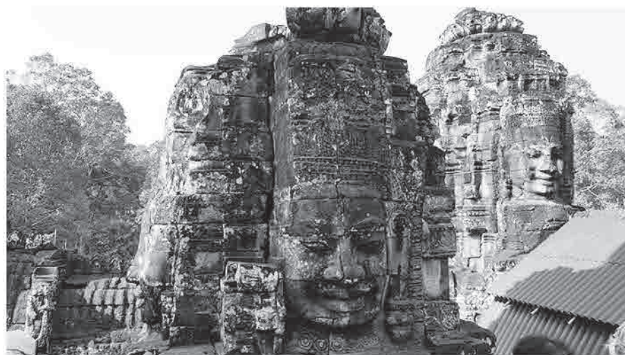
照片二：闍耶跋摩七世的頭像