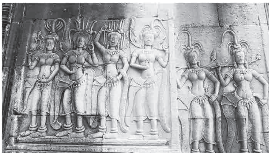
照片一：牆壁仙女的浮雕

城，並修建巴戎廟。闍耶跋摩七世活到90歲，經歷了蘇利耶跋摩二世的鼎盛、外敵的入侵、國家的重建，目睹無數次的興衰榮辱，他皈依了大乘佛教，對於萬事萬物的成、住、壞、空，了然於胸。闍耶跋摩七世修建了巴戎廟，共有49座高塔，加上周圍的5座門塔，共有54座塔，象徵當時吳哥王朝版圖共有54個省份，領土遍及現在的泰國、寮國、越南等地。中國元朝曾派遣大臣周達觀出使吳哥一年多，寫下「真臘風土記」是現存最早的歷史記載。巴戎廟54座高塔的四面刻有闍耶跋摩七世的頭像，由於受到印度大乘佛教文化的影響，形象有如佛陀在靈山法會拈花，迦葉會意的微笑。闍耶跋摩七世看盡了世事的興衰生滅，參透了萬事萬物成、住、壞、空的道理，眼神低垂，會心的微笑，千年來指引著苦難的柬埔寨人民，期待在柳暗花明間，重新站起。