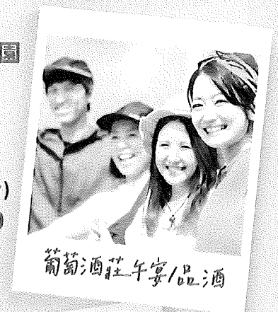
葡萄酒莊午宴/品酒