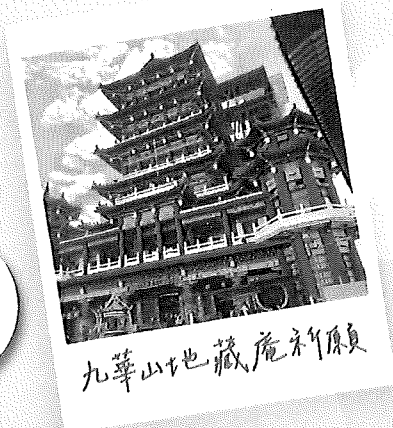
九華山地藏庵新景