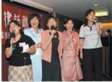
▲本會女幹部上台高歌