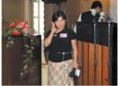
▲大會司儀-本會計雅芬秘書長