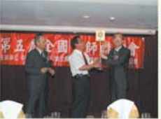
▲交接給下屆聯誼會承辦之新竹公會