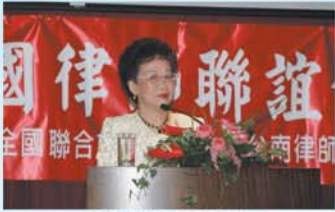
▲呂副總統親臨會場專題演講

二十五日上午九時，全體理事會即陸續抵達台南，當日上午十時在大億麗晶酒店召開全體聯誼會，由林理事長主持，會後聚餐。中午十二時二十分工作人員即已就位，進行報到事宜。副總統沈鴻烈紀念品及環保袋，進行了四本介紹台南的小冊子與環保袋，均極為沈重。大家合力搬運到太億麗晶酒店的大廳，運不到預定的下午一點半，就有道員前來報到。兩點多是放忙碌的時候，紀念品、環保袋陸續送出。兩點半，大致到齊了，於是開車前往仁德保安工廠區內的奇美博物館，大家在各聯誼會廳，參觀充滿西洋藝術氣息及古生物標本等，大家對奇美館董事長的財力、魄力無不欽佩。四時半，集合上車返回台