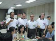
▲六月廿六日於慶平海產午餐