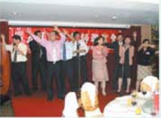
▲本會會員大合唱「期待再相會」