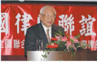
▲司法院翁品生院長致詞