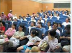
▲參觀博物館看紀錄片