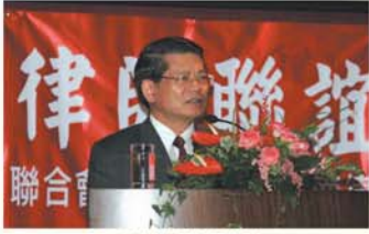
▲法務部湯金全次長致詞