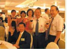
▲六月廿五日於大億麗晶晚宴