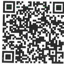
「筆跡鑑定實務及諮詢案例精選」課程 QR Code

四、本課程採網路報名，欲報名者，請由「財團法人金融法制暨犯罪防制中心（ www.iafi.org.tw ）」進入「課程系統」報名，或掃描下方 QRcode 填妥報名資料辦理報名程序，報名時間至 111 年 11 月 25 日(週五)截止。